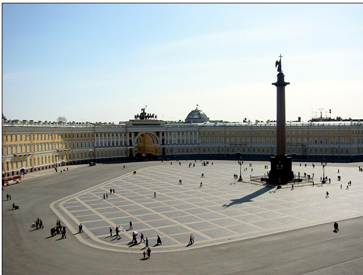
Моя любимая площадь

Я очень люблю свой город Санкт-Петербург! Мне очень нравится Дворцовая площадь, особенно ее украшают колонны и, конечно же, Эрмитаж. Очень интересно, когда на Дворцовой площади проходят мероприятия. Особенно, когда проходит парад 9 Мая. Люблю смотреть, как едет военная техника, как летят самолеты, стреляют из пушки.